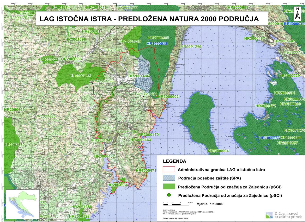
Slika 2. LAG „Istočna Istra“ – predložena NATURA 2000 područja