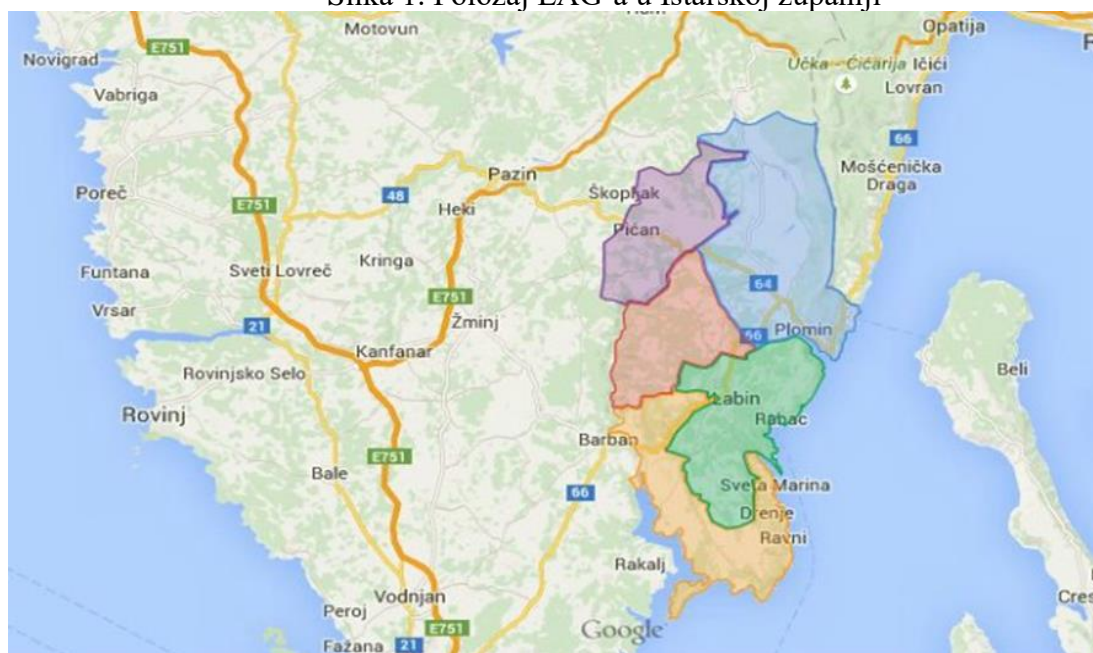
Slika 1. Položaj LAG-a u Istarskoj županiji